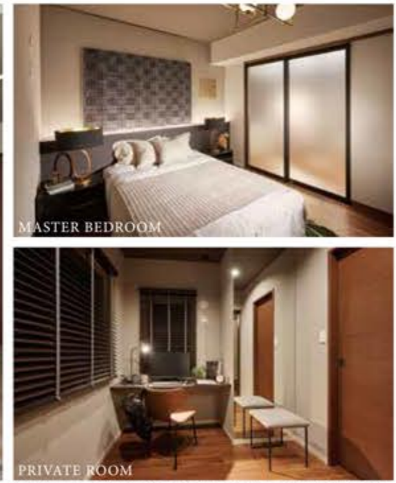
※掲載の写真は、マンションギャラリー内モデルルームを撮影し(2023年5月)したものに一部合成を施しており、実際の仕様・仕上げと異なる場合があります。家具・設備等は販売価格に含まれておりません。

PLANNING / 暮らすほどに快適性が実感できる、こだわりを尽くした間取りプランをご用意しています。