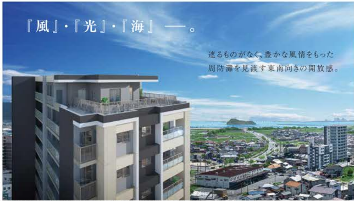
※掲載の写真は現地付帯を撮影し、(2023年6月)、CG加工を加えたものでイメージです。CGパースは図面を基にしたもので、実際とは多少異なります。